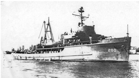
IMAGEN 1: USS ATA -200, luego Leucoton. En la foto, a proa, se puede observar el cañón doble de 20 mm.

Su tripulación era de 5 oficiales y 40 marinos y sus armas eran un cañón antiaéreo de 3 pulgadas calibre 50 y un cañón doble antiaéreo de 20 milímetros.