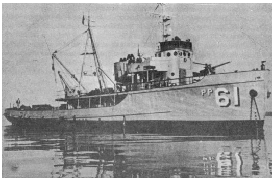
IMAGEN 4: Repintado con PP. 61, que significa patrullero 61, al ser rebautizado como Leucotón.

Apenas dos años de terminada la II Guerra mundial, en Septiembre de 1947, el USS ATA 200 es vendido a la armada chilena y rebautizado como Leucotón (PP 61).