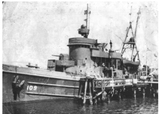
IMAGEN 5: USS POTAWATOMI. (ATF 109). A Proa se puede observar el cañón antiaéreo 3"/calibre 50.

El USS ATA 200, pesaba 1.240 toneladas y medía 205 pies de eslora, su tripulación estaba constituida por 5 oficiales y 80 marinos. Sus unidades motrices eran 4 motores de 750 hp Busch-Sulzer BS-539 Diesel y dos motores auxiliares General Motors 3-268 a de 1500 HP.